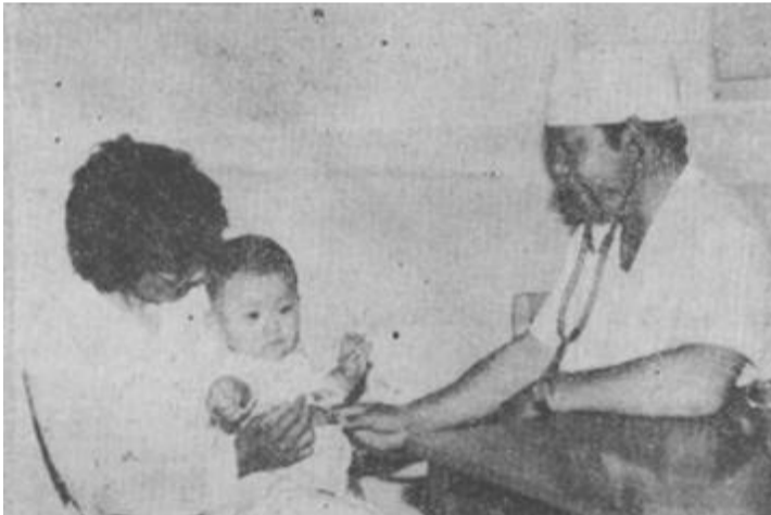
韩北村积极发展独生子女福利事业